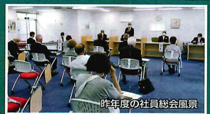
昨年度の社員総会風景

令和4年 6月24日（金）10時～12時 会場：多摩市シルバー人材センター会議室