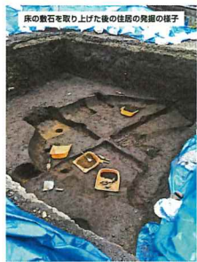
床の一部に敷石があり炉や柱の穴も確認されています。4500年前の人々の暮らしを忍んでパチリ！

当センターの作業車両基地・倉庫として使用中の和田施設では、6月21日から7月2日に発掘調査が実施されました。その結果、縄文時代の住居あとが検出されました。