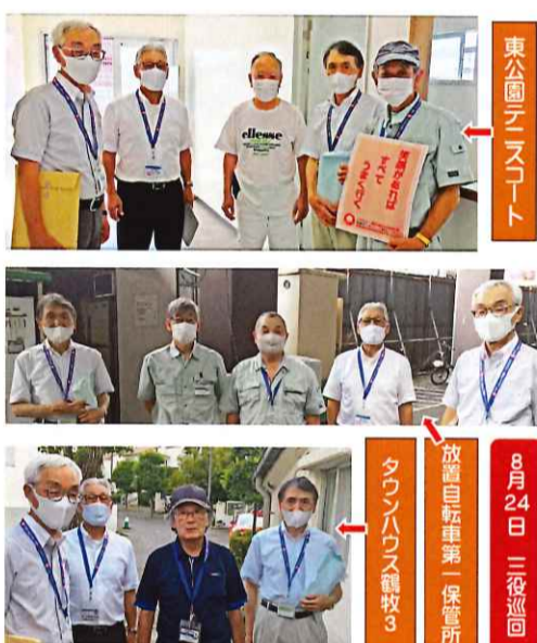
東公園アスコート