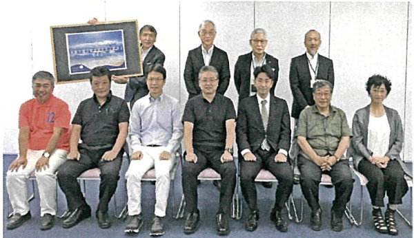
市議会健康福祉常任委員会との懇談会出席者

和やかな雰囲気の中で有意義な懇談会に 本年5月の市議会臨時会で改選された多摩市議会健康福祉常任委員会の方々、8月7日センターに来所され執行部と懇談会を開催しました。 この委員会は超党派の議員7名で構成する委員会、今回で通算4回目となります。 挨拶交換後、センターの概要説明として、理事長からセンターの経営方針を、また常務理事からセンターの特徴や事業実績等について説明した後、主に次のような意見交換が行われました。